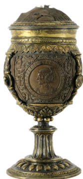
Noix de coco montée en calice