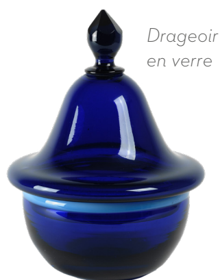
Drageoir en verre

Le rejet des techniques traditionnelles et la diminution de l'importance accordée aux savoir-faire ont pu faire croire à un déclin du matériau dans la sphère artistique contemporaine. Au cours du 20 e siècle s'aiguise la conscience des limites encadrant les media traditionnels des Beaux-Arts. Pourquoi peindre à l'huile et sculpter le marbre alors qu'est offerte une gamme immense de matériaux, directement issus du quotidien ? Dès lors, les matériaux et les techniques ne marquent plus les bornes de la créativité mais ouvrent un champ immense d'expérimentations. Des œuvres du FRAC Grand Large – Hauts-de-France seront visibles dans cette section.