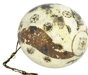
Oeuf d'autruche décoré